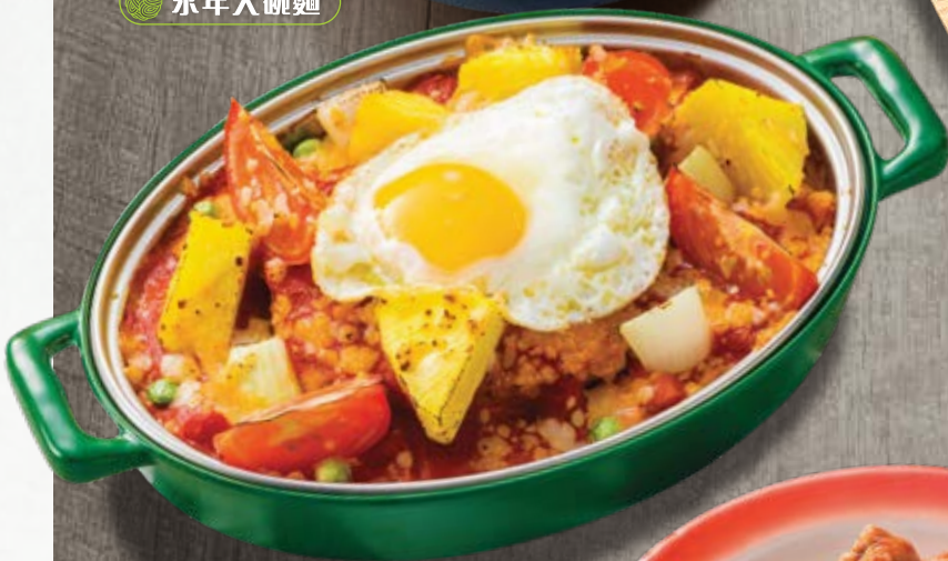
芝士焗鮮菠蘿蕃茄 豬扒煎蛋飯