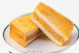
花生醬流心西多士