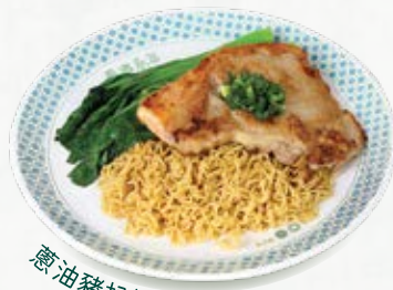
蔥油豬扒撈公仔麵